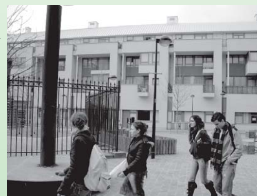
Trend: oog voor de sociale vermenging

Op dit ogenblik telt Brussel zo'n 38 000 sociale woningen. Dat is acht procent van alle woningen, een druppel op een hete plaat.