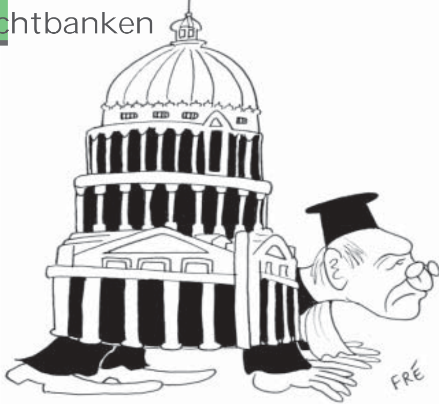
Gerechtelijke achterstand weegt zwaar door in Brussel

Dat er wel eens wat misloopt bij de Brusselse rechtbanken is een grof understatement. Jarenlang wachten op een uitspraak, rechters die geen drie woorden Nederlands spreken: het behoort allemaal tot de geplogenheden.