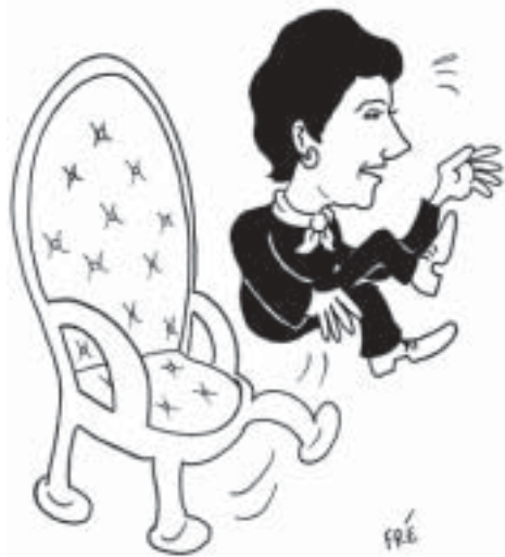
Stoelendans bij sp.a Brussel