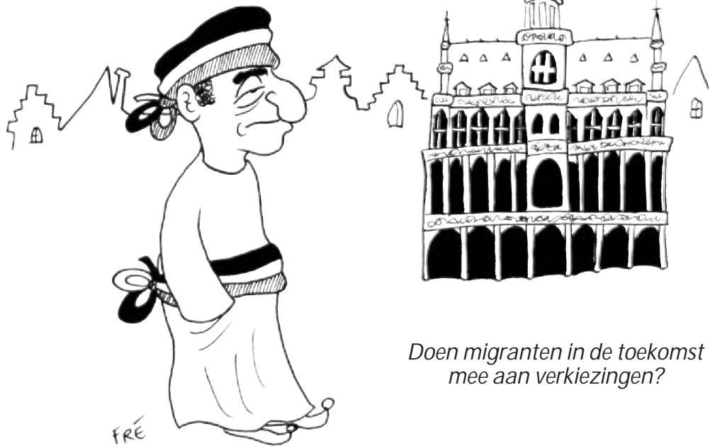
Doen migranten in de toekomst mee aan verkiezingen?

Mogen migranten die hier vijf jaar wonen mee kiezen wie burgemeester wordt? Het voorstel doet de emoties hoog oplopen. In Brussel hebben de meeste migranten al stemrecht. Dankzij de snel-Belgwet.