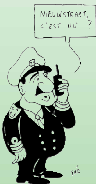
Vindt de politie de juiste weg?