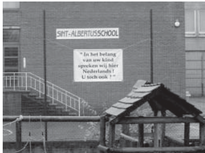
Nederlandstalig basisonderwijs trekt 18 procent Brusselse kinderen aan

Gaan de Nederlandstalige scholen in Brussel ten onder aan hun eigen succes? Dat vragen steeds meer ouders zich luidop af. Het aantal leerlingen is er de jongste jaren fors gestegen. Steeds meer anderstalige leerlingen vinden hun weg naar onze scholen. Die toevloed heeft echter ook nadelen.